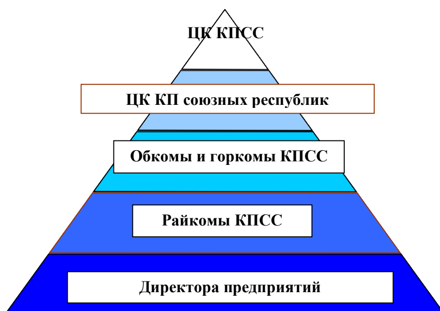
Рис.1.2 Система «власть - собственность» в СССР

Созданный бюрократический аппарат можно представить как структуру, в которой можно выделить высшее, среднее и низшие звенья. С некоторой долей условности к высшему относят бюрократический аппарат центральных органов, к среднему – чиновников областных органов и к низшему – работников управления заводов, фабрик 5 . В результате система «власть - собственность» претерпела изменения (См. Рис.1.2).